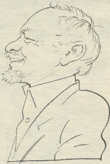
Дружеский шарж А. КРЫЛОВА

Чрезвычайно трудно объяснить, почему человек, считающийся нормальным и практически здоровым, принимается писать фельетоны.